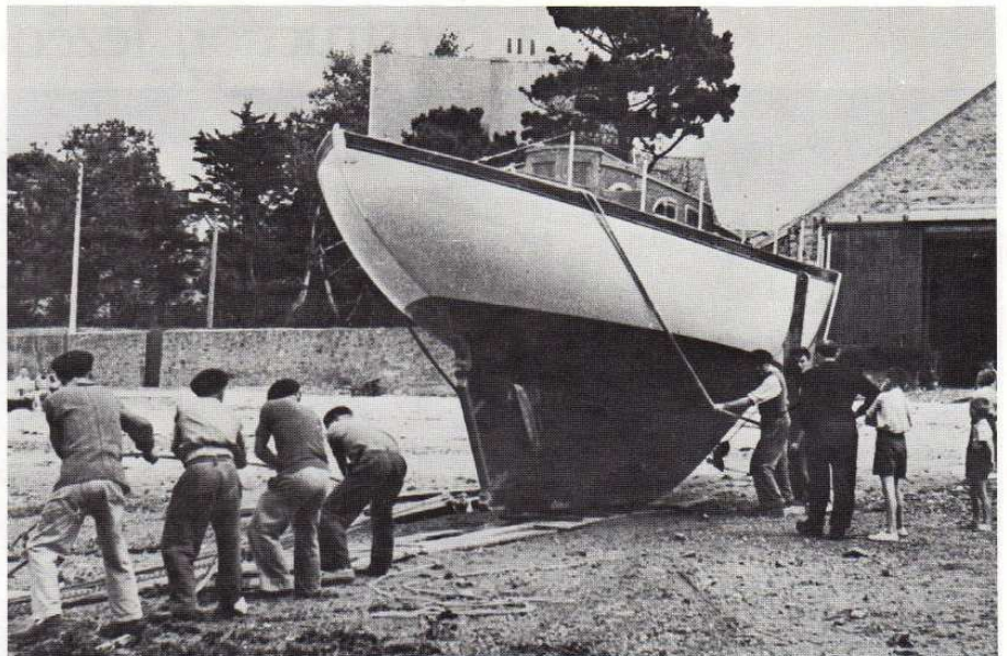
Lancement du Dieu me garde , un grand ketch de croisière sur plans Cornu (1950). Chez Jézéquel, toutes les mises à l'eau se font avec des moyens réduits à l'essentiel : un chemin de planches, quelques « roules » métalliques, des bras solides... et beaucoup de doigté.

L'un de ces bateaux deviendra célèbre sur les côtes bretonnes. Il s'agit du Jabadao , 8 m C.R. lancé en 1958 ; peut-être la plus belle réussite d'Eugène Cornu (avec des proches cousins comme